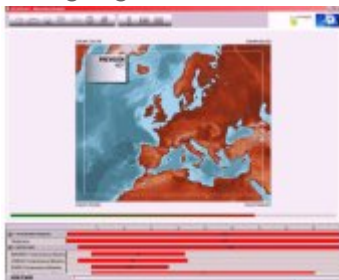
Anima la presentación